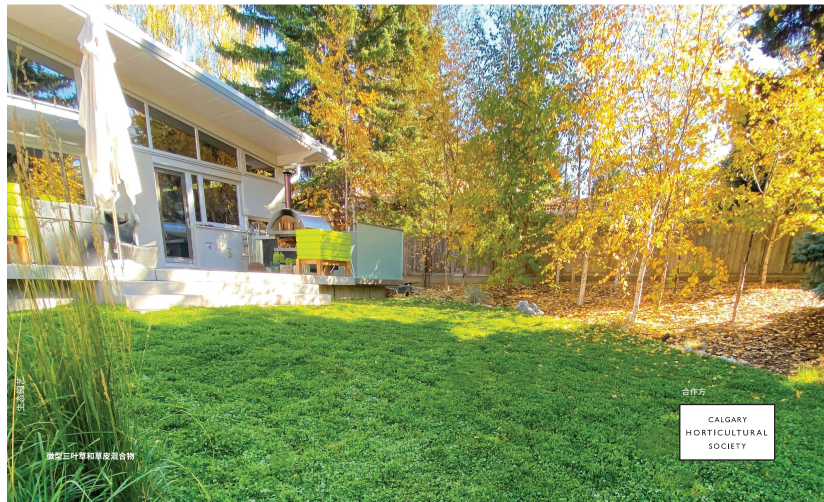
微型三叶草和草皮混合物

用既能吸引传粉者又能减少维护的美丽替代品,替代部分草坪,让您的庭院焕然一新。在卡尔加里享受节水、有韧性的景观。